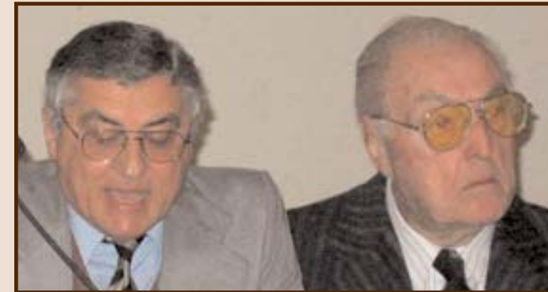
El Dr. Horacio Micucci junto al Tte. Cnel. Adolfo C. Philippeaux, el 12 de agosto, en el acto del día de la Reconquista de Buenos Aires.

Como su oposición al golpe de 1976. O su lucha por el no pago de la deuda externa ilegítima y fraudulenta. O su defensa de la pesca nacional. O, recientemente, su oposición a la participación de la Fuerzas Armadas Argentinas en Haití, oposición premonitrice a luz de los sucesos ocurridos en estos días. Y, en fin, su férrea oposición activa a todo lo que significara la