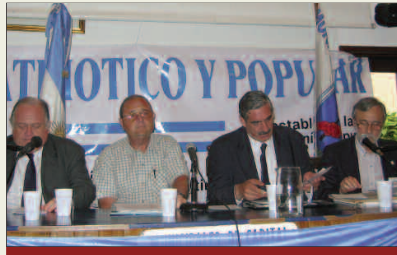
Defensa Nacional: La Defensa Nacional concebida integralmente exige unir en concurso la condición militar y civil aludidas, gracias a una concepción de la política como ciencia práctica en términos de plenitud significativa, desde el horizonte de una adecuada concepción del ser social.

Un aspecto de esta es la memoria sin la que toda identidad humana se