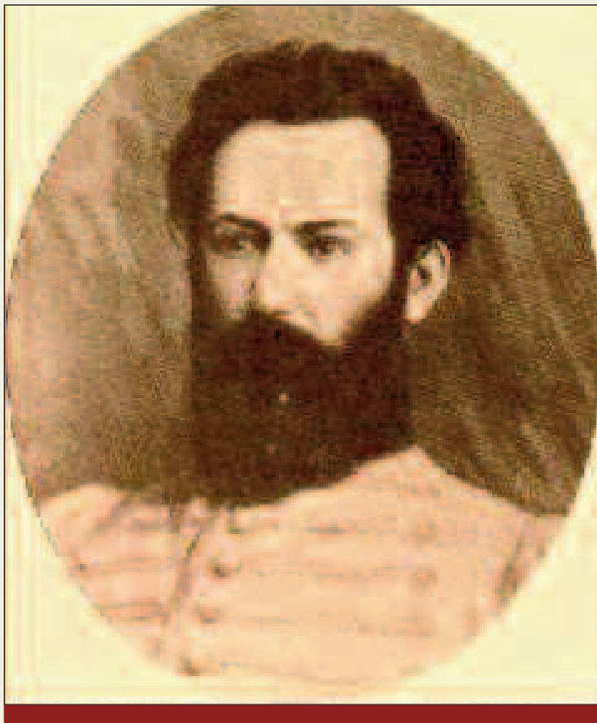
La guerra partisana: La guerra partisana es una manera muy especial de combatir que se derivan de su esencial "irregularidad" en comparación con el ejército clásico, pero, como dice Karl Schmitt en su Teoría del Partisano "(...)la conexión con ese factor regular por remoto que sea, es lo que básicamente diferencia al partisano de un nihilista y de un salteador de caminos".

realizarse sobre el permanente reequipamiento de las Fuerzas Armadas chilenas, su despliegue con centro de gravedad en el sur y su adiestramiento ofensivo.