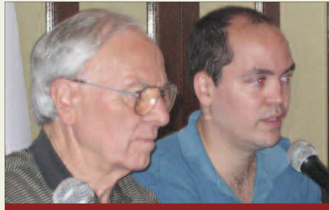
Una cuestión fundamental: sigue siendo clave tener una política a favor del desarrollo industrial y tecnológico y lógicamente ese desarrollo esta fuertemente vinculado a las condiciones de vida de nuestro pueblo, al servicio de nuestra capacidad de negociación, a nuestra capacidad de defensa.

Si seguimos en este contexto y le agregamos que estos subsidios son para la financiación de equipamiento y prácticamente cortan y eliminan todo lo que puedan ser gastos en recursos humanos. Hay un ejemplo típico en ingeniería de la UBA que uno puede ver cómo son las políticas de subsidios