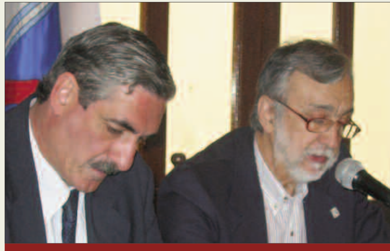
Documento Fundacional: "Bregaremos por la recuperación de nuestra Marina Mercante de bandera argentina, pilar del transporte interior y exterior del país y de la defensa nacional; como así también por la nacionalización del comercio exterior".

El saldo fue 100 barcos entrados en 6 años, algunos de ellos buques frigoríficos construidos en Inglaterra, como el Eva Perón, Presidente Perón y el 17 de octubre, que luego fueron el Uruguay, Libertad y el Argentino.