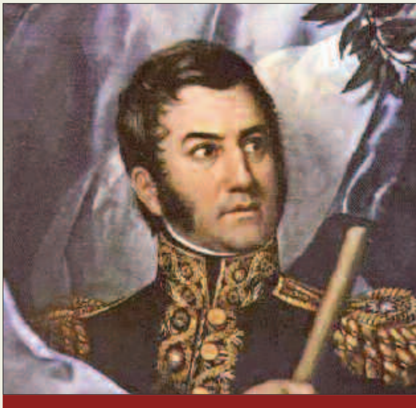
La Defensa Nacional y la Argentina: Consideramos la Defensa Nacional Argentina por historia y por necesidad como la conservación dinámica de nuestro cuantioso patrimonio; decimos dinámica porque incluimos en sus contenidos la recuperación de lo perdido o cercenado en todos los campos del quehacer nacional: espacial (espacios terrestres, aéreos y marítimos), económico-financiero, cultural etc.

sión con los peligros inherentes, entre ellos que la Paz se confunda con una capitulación permanente.