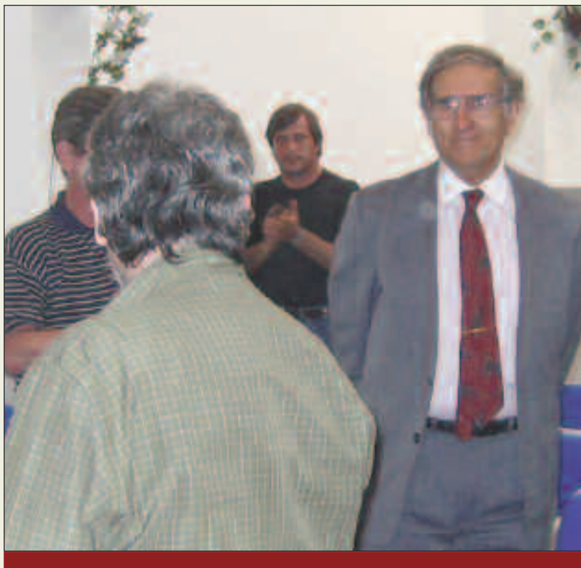
Presencia destacada: El Coronel Mohamed Alí Seineldín acompañó al último panel de la Jornada sobre Defensa. El público lo recibió afectuosamente. En la foto, el momento en que recibe el aplauso de la concurrencia a su llegada.

medios de comunicación masivos, y el bombardeo es permanente. ¿Y qué mensaje nos transmiten? "Contra esto no se puede hacer nada", "bajen los brazos" y "al que quiera enfrentarnos le cortamos la cabeza".