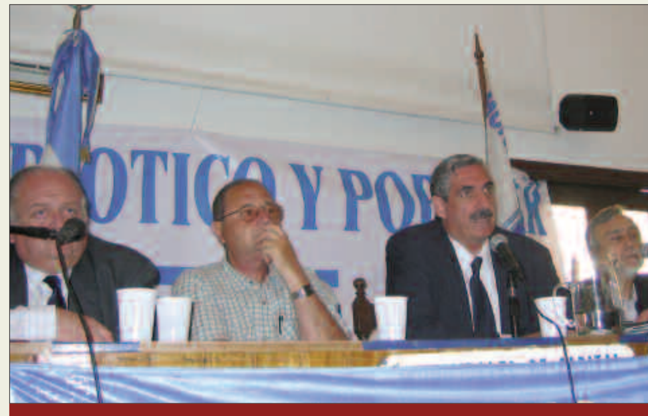
Malvinas: Es una causa nacional, es y va a seguir siendo el punto de inflexión de la causa nacional, que a partir de Malvinas los nacionales podemos estar unidos para no permitir que nos destruyan nuestro Estado Nación, que Malvinas vive en el corazón de la mayoría de los argentinos bien nacidos.

También, y un aspecto que hay que estudiar, es que las emigraciones del siglo pasado, de 1900, 1904, así como los que vinieron después de la Primera Guerra mundial y de la Segunda Gran Guerra, que hizo ese crisol de razas todos unidos; que también por primera vez todos unidos lucharon por la argentinidad. Italianos, españoles, árabes, alemanes, y otros inmigran-