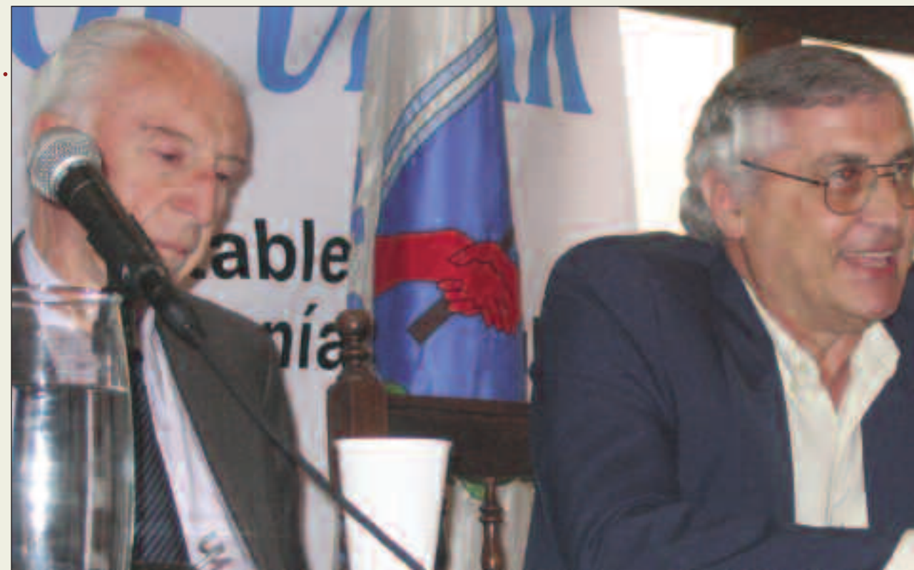
Movilizar por la causa de Malvinas: Los ingleses consideran que si después de terminar los estudios de todos los datos relevados es favorable la conclusión, van a empezar a explotar a fines de 2004 o primera mitad de 2005, esa es la perspectiva. La existencia de petróleo en las islas Malvinas aumenta enormemente la apetencia británica por quedarse con las islas.

De modo tal que por ahora no están en grave crisis o problema